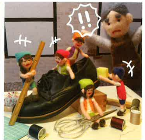
しかしある晩靴屋に小人がやってきて親父 さんに仲間の大切さを気づかせてあげる のでした