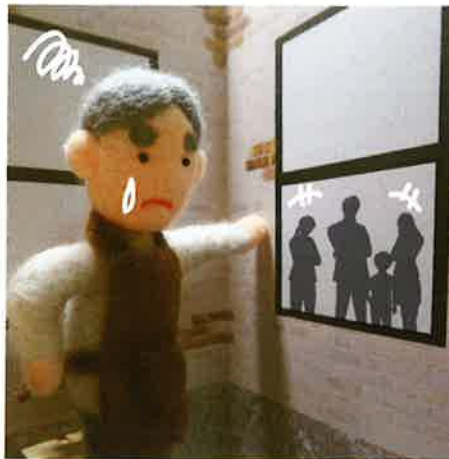
春のミモザ祭りが 近づいたのに街のみんなど 仲良くできません