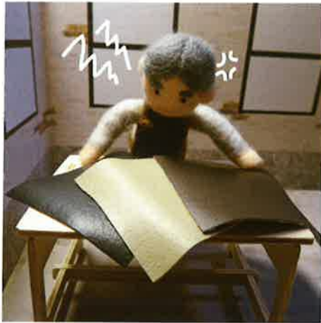
腕は良いけれど気難しい 靴屋の親父さん