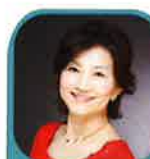
メゾソプラノ 石田まり子