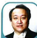
バリトン 則竹正人