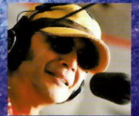
タック・ハーシー

車いすでも安心! FMノースウェーブの人気DJタック・ハーシーによる わかりやすい解説付きで、ジャズ初心者でも楽しめる!